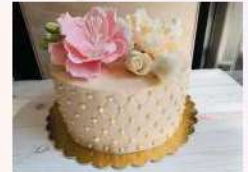
Egy emeletes torta