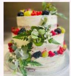
Három emeletes torta