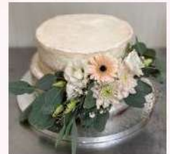
Két emeletes torta