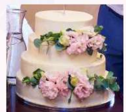
Négy emeletes torta